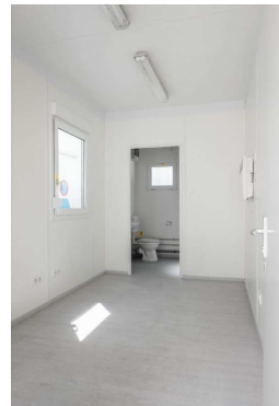
Position von Tür und Fenster ist indikativ / posizione di porte e finestre è indicativa