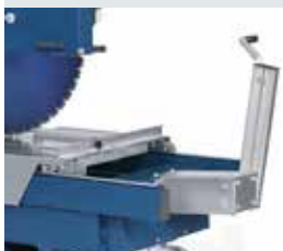
[ 1 ] DTS 1000 V