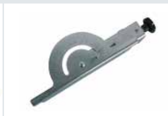
[ 3 ] Arresto laterale graduato