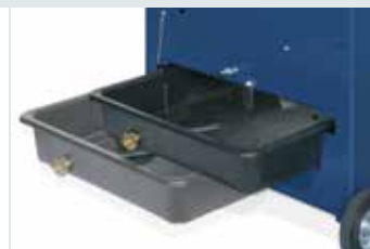
Vasca dell'acqua estraibile dal retro