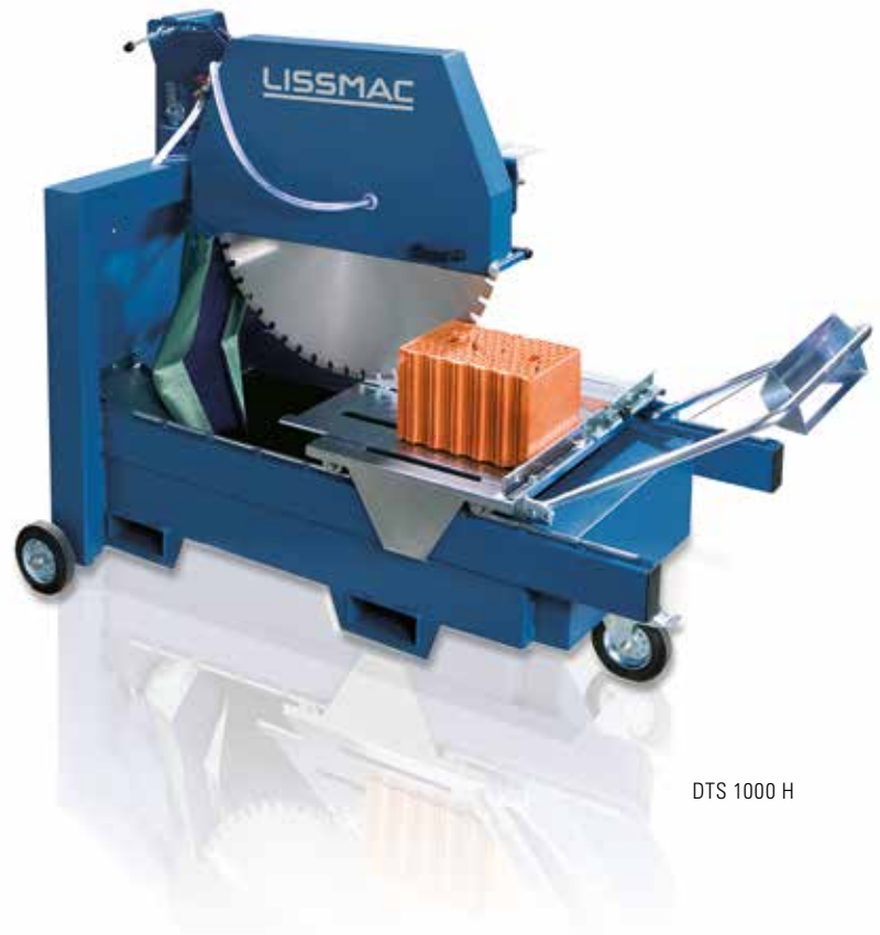
DTS 1000 H