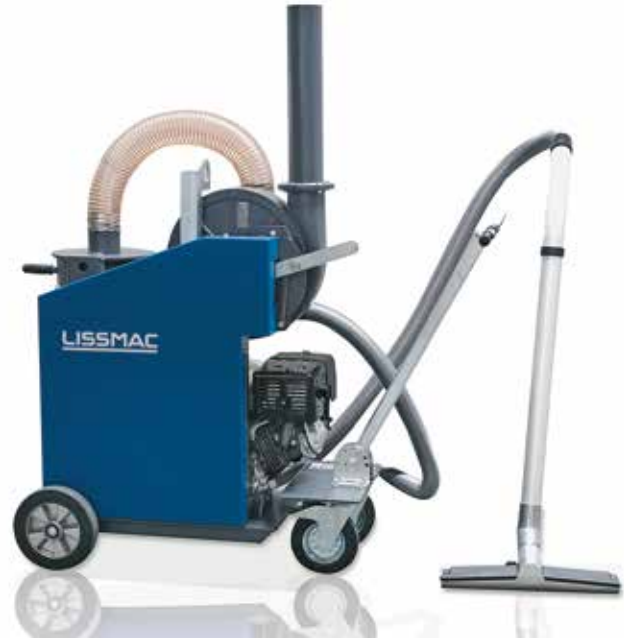
VACUUM-WET 100 P