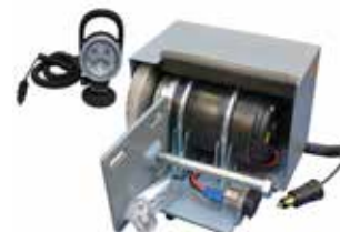
[ 4 ] Kit alternatori