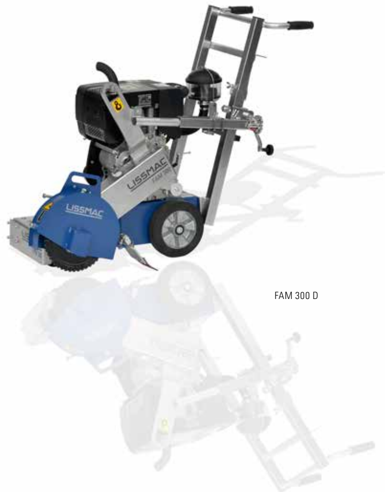
FAM 300 D