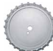
[ 8 ] Fresa diamantata