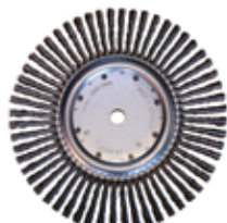
[ 6 ] Spazzola tonda