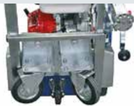
[ 2 ] Kit ruote per funzione fresa