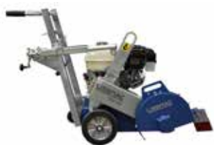
[ 1 ] FBM 300