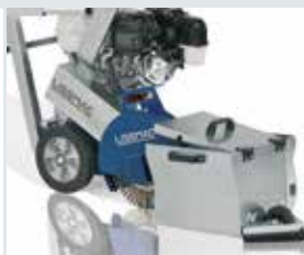
[ 3 ] Recipiente raccolta residui di lavorazione