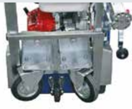
[ 2 ] Anbau-Lenkradsatz