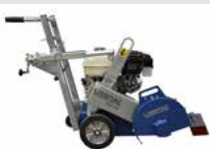
[ 1 ] FBM 300