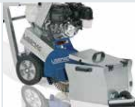
[ 3 ] Schmutzauffangkorb