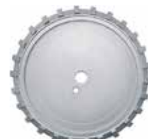
[ 8 ] Diamant-Fasenfräser