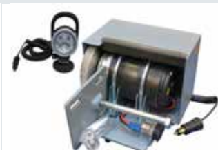
[ 4 ] Lichtmaschinen-Kit