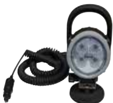
[ 5 ] Arbeitscheinwerfer