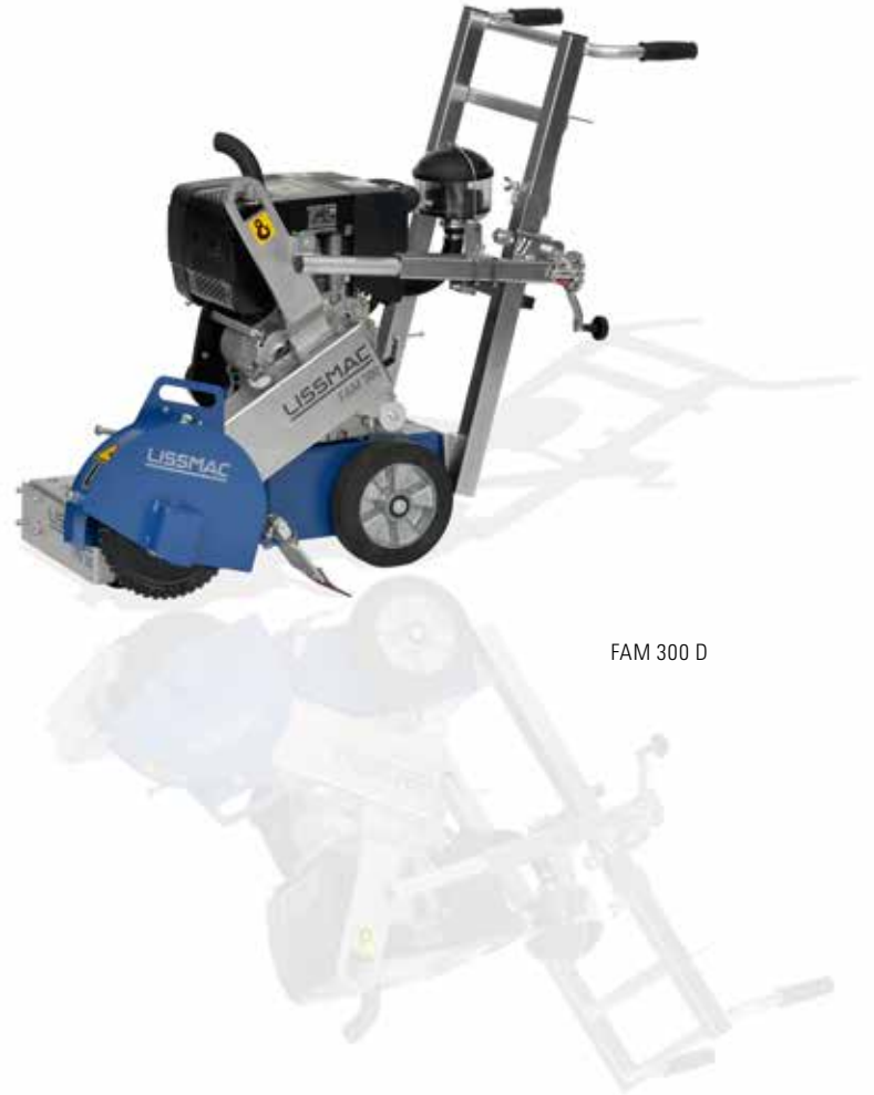
FAM 300 D