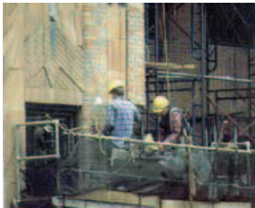
In flessione L'edilizia sta soffrendo una fase recessiva

per cento Il calo di ore lavorate nel 2009 nell'edilizia registrato dalla Cassa edile e comunicato a fine novembre