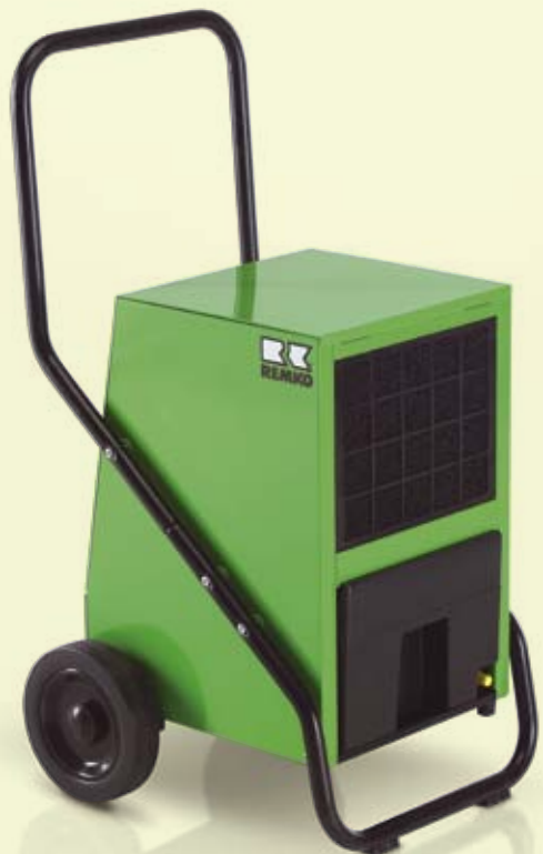
REMKO AMT 40-E