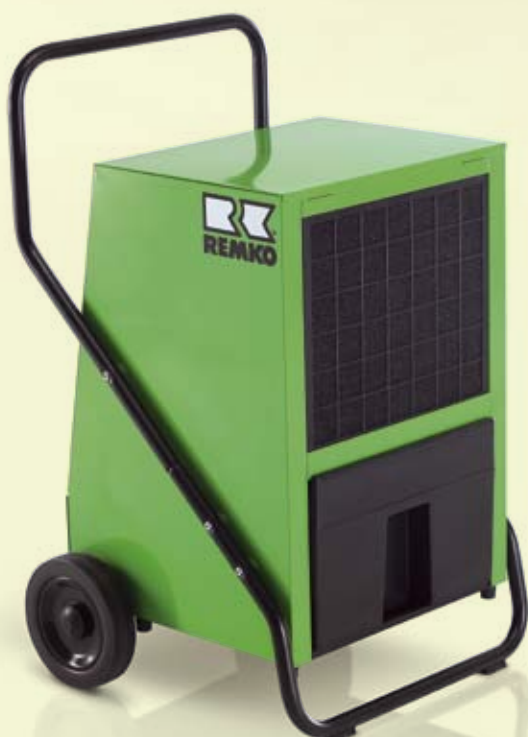
REMKO AMT 80-E