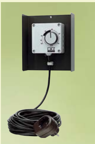
REMKO Raumhygrostat, Typ HR-1, zur vollautomatischen Steuerung, steckerfertig

REMKO Luftentfeuchter eignen sich hervorragend zur wirtschaftlichen Raumtrocknung im Keller und Trockenkeller, Hobbyraum, Wintergarten, Bad, Werkraum, Freizeitraum, Archiv, Lager etc.