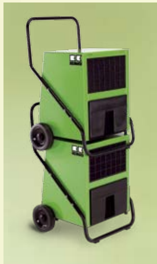
REMKO Luftentfeuchter sind stapelbar

Die fahrbaren Luftentfeuchter REMKO AMT sind leicht zu bedienen und garantieren störungsfreien Dauereinsatz rund um die Uhr.