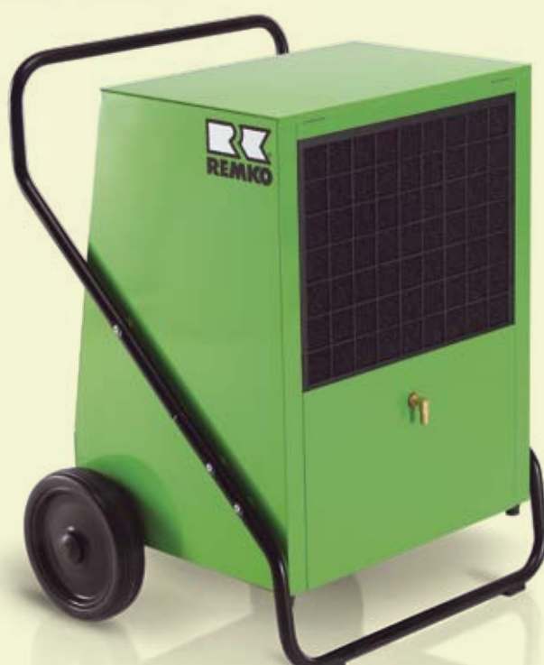
REMKO AMT 110-E